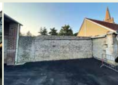
▲ La démolition des anciens sanitaires de l'école a permis de découvrir des beaux murs anciens que nous allons remettre en état.