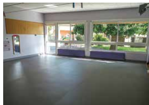
▲ Réfection du sol à l'école Jean de la Fontaine