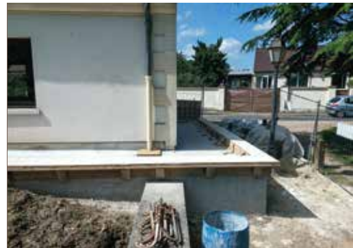
▲ Accès PMR à Salomon de Brosse