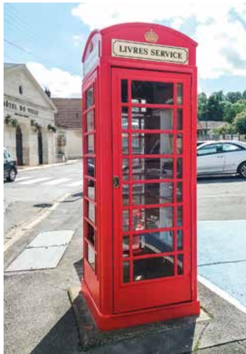
▲ Remise à neuf de la cabine « Livres service »