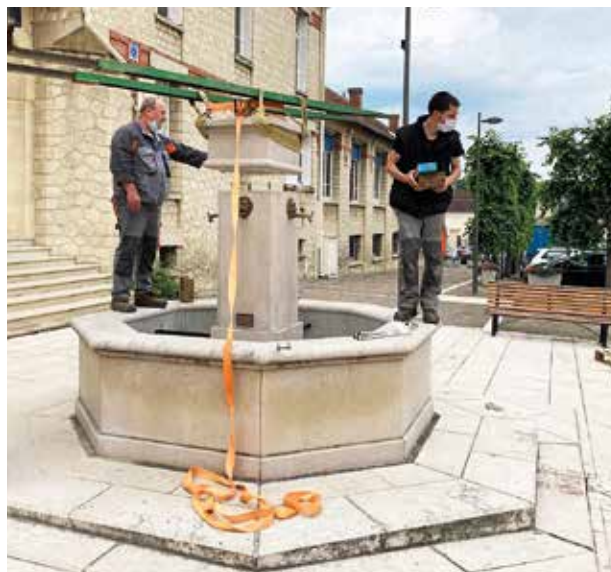
▲ Remise en état de la fontaine