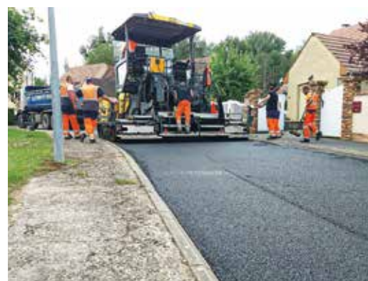
▲ Nouvel enrobé à Vert Village