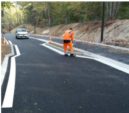
Traçage de la signalisation horizontale