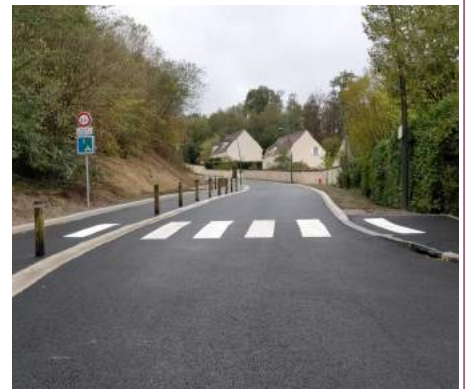
Finalisation de la voirie

Les potelets de sécurité et les mats porteurs de vasques fleuries, situés sur la place de l'Eglise ont été repeints par les services municipaux.