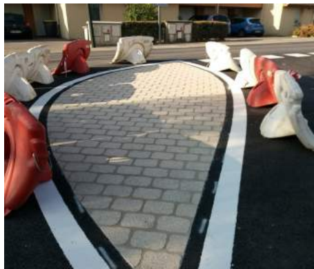
Réalisation de l'îlot