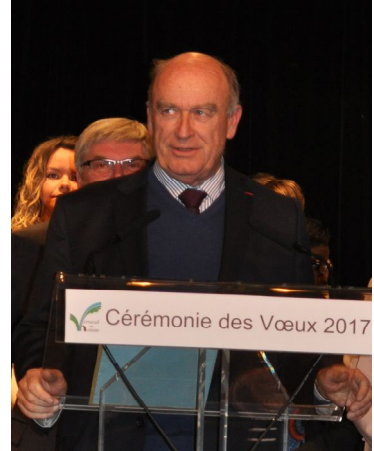
Alain Vasselle, Sénateur de l'Oise