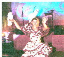
Danseuses Espagnoles Groupes de musiciens