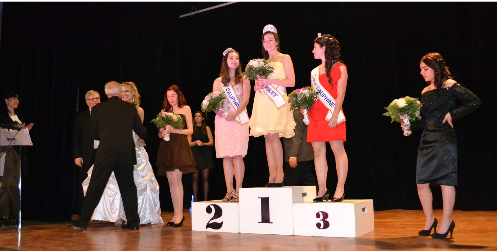
Élection de la Reine et des Dauphines, samedi 2 avril 2016 à la salle des Fêtes