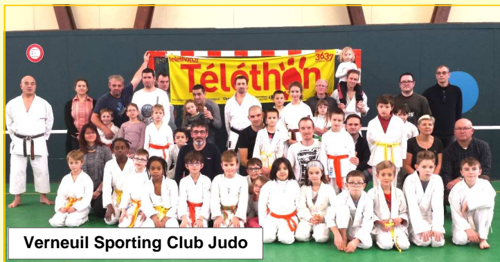
Verneuil Sporting Club Judo