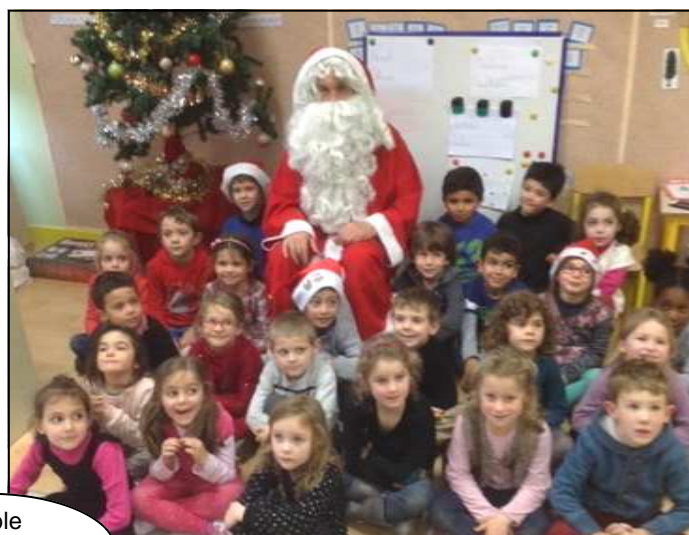
École Jean de la Fontaine