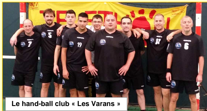
Le hand-ball club « Les Varans »