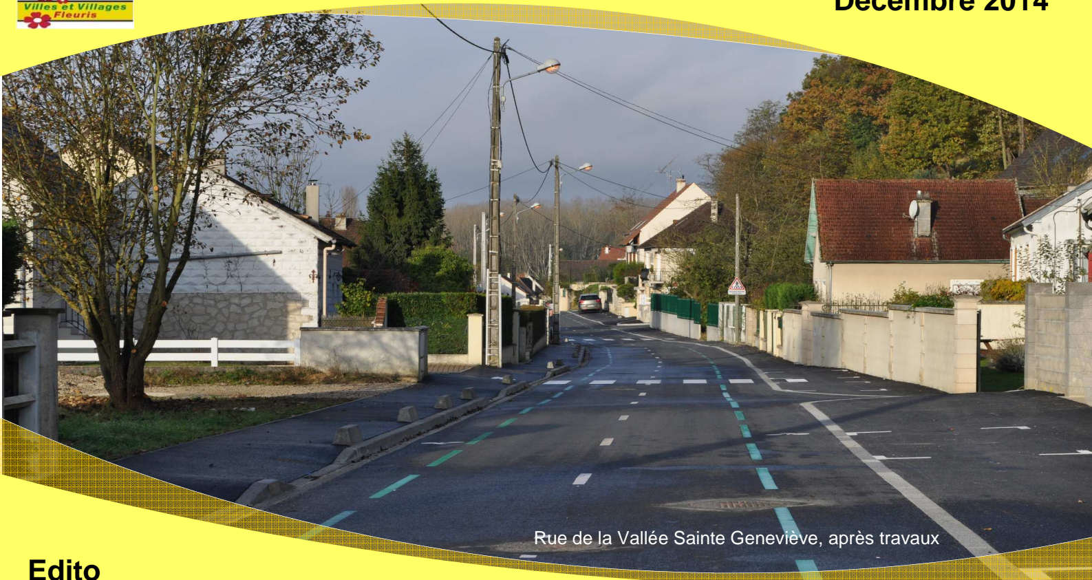
Rue de la Vallée Sainte Geneviève, après travaux