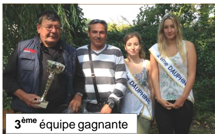
3 ème équipe gagnante

Samedi 13 septembre, l'APVH a organisé à l'étang du Moulin d'EnHaut son concours " Trophée Malige " qui est une pêche au blanc par équipe. Etaient engagées 13 équipes avec une forte participation des jeunes. Ils ont tous été récompensés.