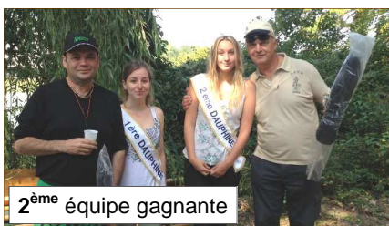
2 ème équipe gagnante