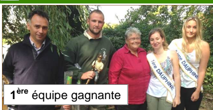
1 ère équipe gagnante