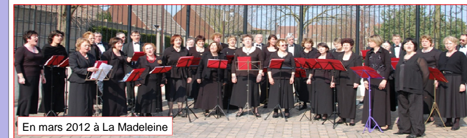
En mars 2012 à La Madeleine

Le Chœur des Aulnes vous invite à venir l'écouter :