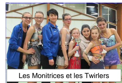
Les Monitrices et les Twirlers

Le dimanche 16 février, nous avons participé au Championnat de Picardie individuel de Tirwing à Estrées-Saint-Denis. Ce championnat permet également de se qualifier pour le Championnat National (championnat de France) qui aura lieu le 12- 13 avril à la Roche-sur-Yon. Nous avons 5 twirlers engagés, elles ont fait une très bonne compétition voici les résultats :