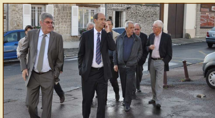
Le vendredi 7 octobre, M. Eric Woerth, Député - Maire de Chantilly, a été accueilli par M. le Maire. Après une présentation de notre commune, Il a ensuite rendu visite aux commerçants du centre-bourg.